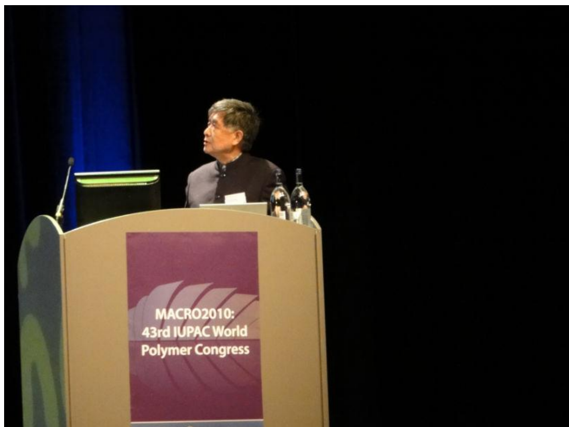
图 19：2010 年 7 月，江明在第 43 届世界高分子大会上作报告

样的讲台上又不宜谈及政治，甚至不宜多发表个人感想。于是，他那天特地穿了中山装做报告。对与会的众多华人科学家来讲，可谓是“意在不言中”。