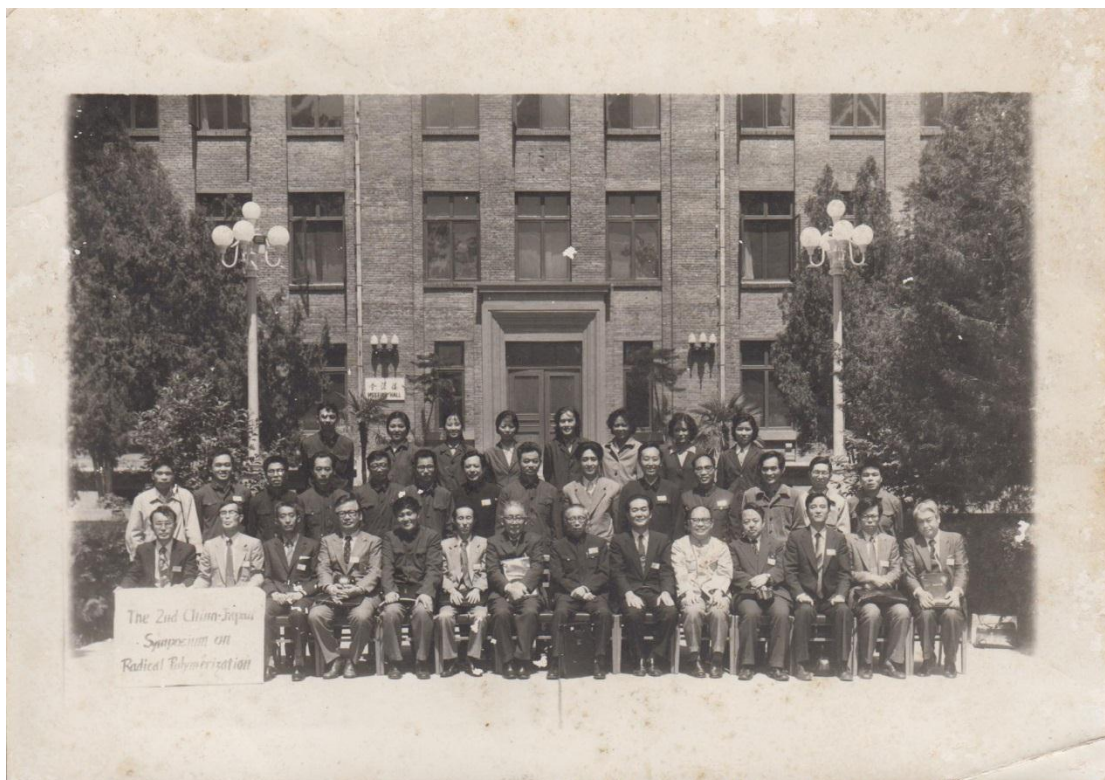
图 14：1981 年，北京，第二届中日自由基聚合讨论会