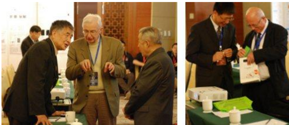
图 18: 2010 年 10 月 27-29 日, 以“功能超分子体系: 多层次的分子组装体”为主题的第 385 次香山学术讨论会召开

这个系列会议反映了我国超分子化学从无到有并发展为具有重要国际影响的学科分支的历程, 这也是中外科学家合作的范例。张希称 Ringsdorf 和沈家骢为“我的二位科学之父”是这种精神的生动写照。